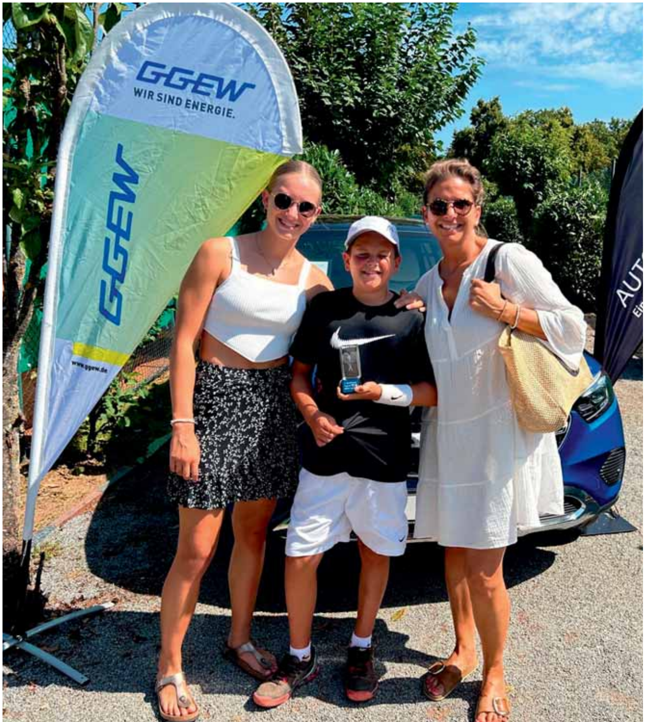
Die besten Fans. Die eigene Familie mit Schwester und Mama.