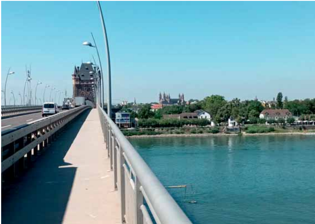
Bild: Die Wormser Rheinbrücke mit dem Nibelungenturm und im Hintergrund der Wormser Dom

Ein schattiger Platz wurde schnell gefunden, so konnten wir uns für die Rückfahrt mit pfälzischem Essen und Bieren von der Hausbrauerei Hagenbräu stärken.