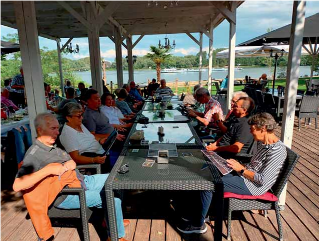
Bild: Eine lange Tafel mit uns 17 Ausfüglern in einer urlaubsreifen Atmosphäre

Rechtzeitig vor dem einsetzenden leichten Regen erreichten wir nach dem Rückmarsch und dem Übersetzen mit der Fähre wieder unsere Fahrzeuge. Ein gelungener Ausflug ging zu Ende.