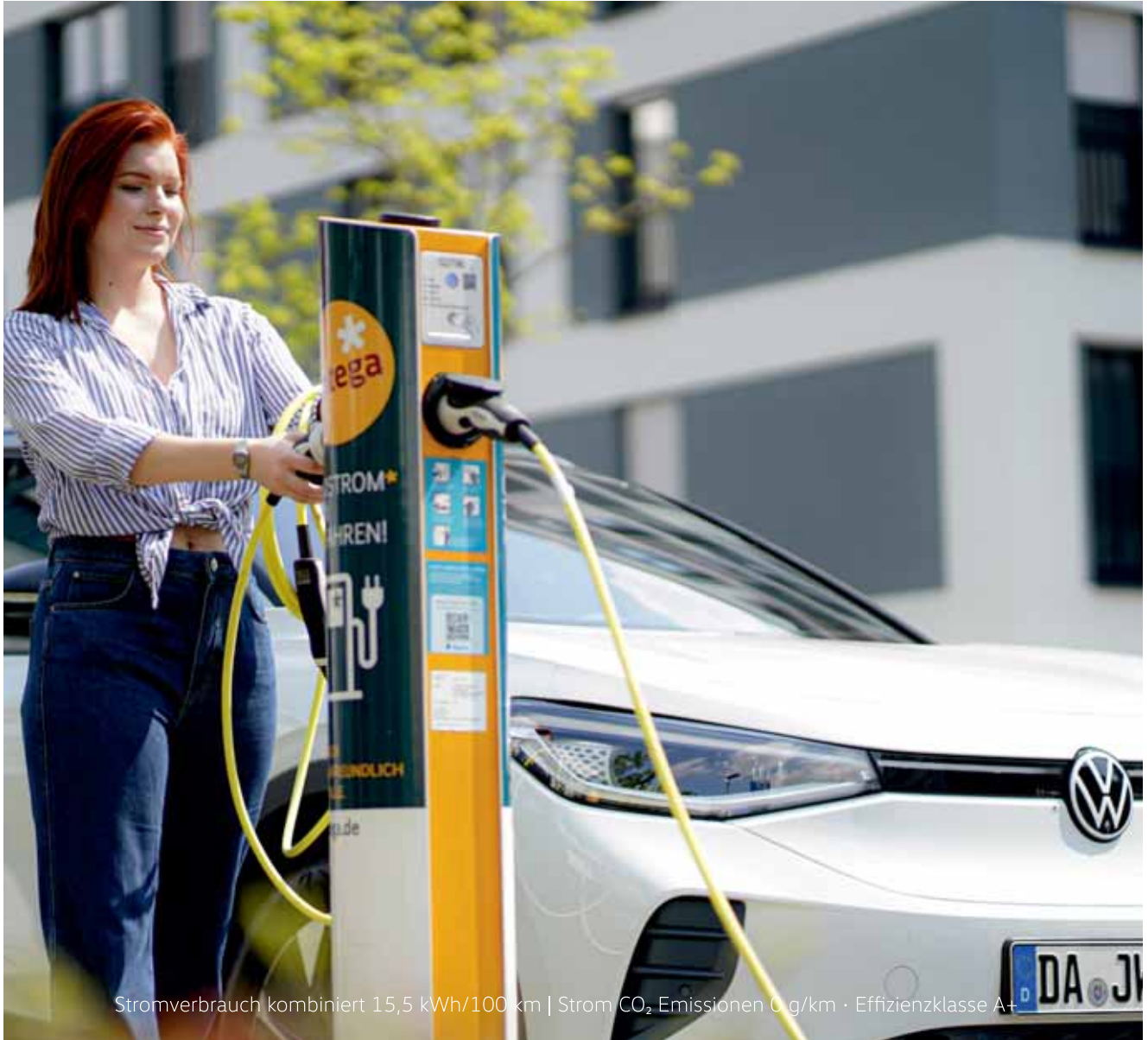
Stromverbrauch kombiniert 15,5 kWh/100 km | Strom CO 2 Emissionen 0 g/km · Effizienzklasse A+